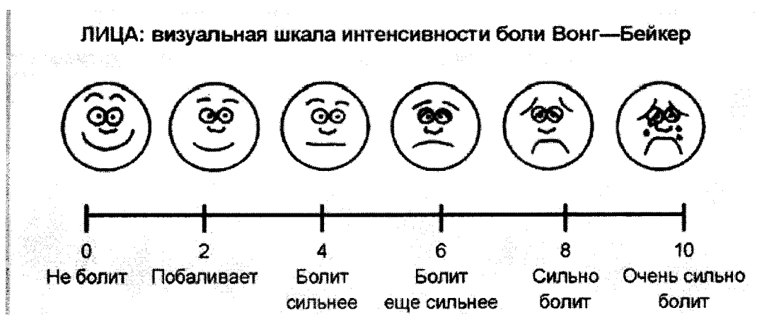
Рис. 1 Визуально-аналоговая шкала оценки боли

Диагностика боли в родах основана только на субъективных ощущениях женщины и характеристика боли, как чрезмерная, является показанием для обезболивания родов. Может использоваться визуально-аналоговая шкала оценки боли (ВАШ) (рис. 1)